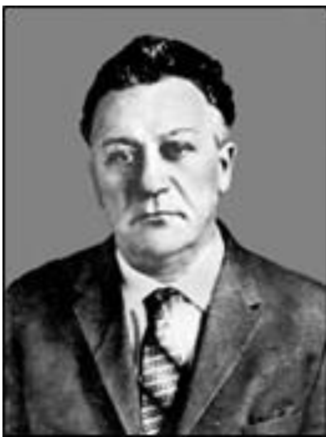
Абрам Исаакович Алиханов Герой Социалистического Труда, трижды лауреат Сталинской премии, кавалер двух орденов Ленина и ордена Трудового Красного Знамени, академик