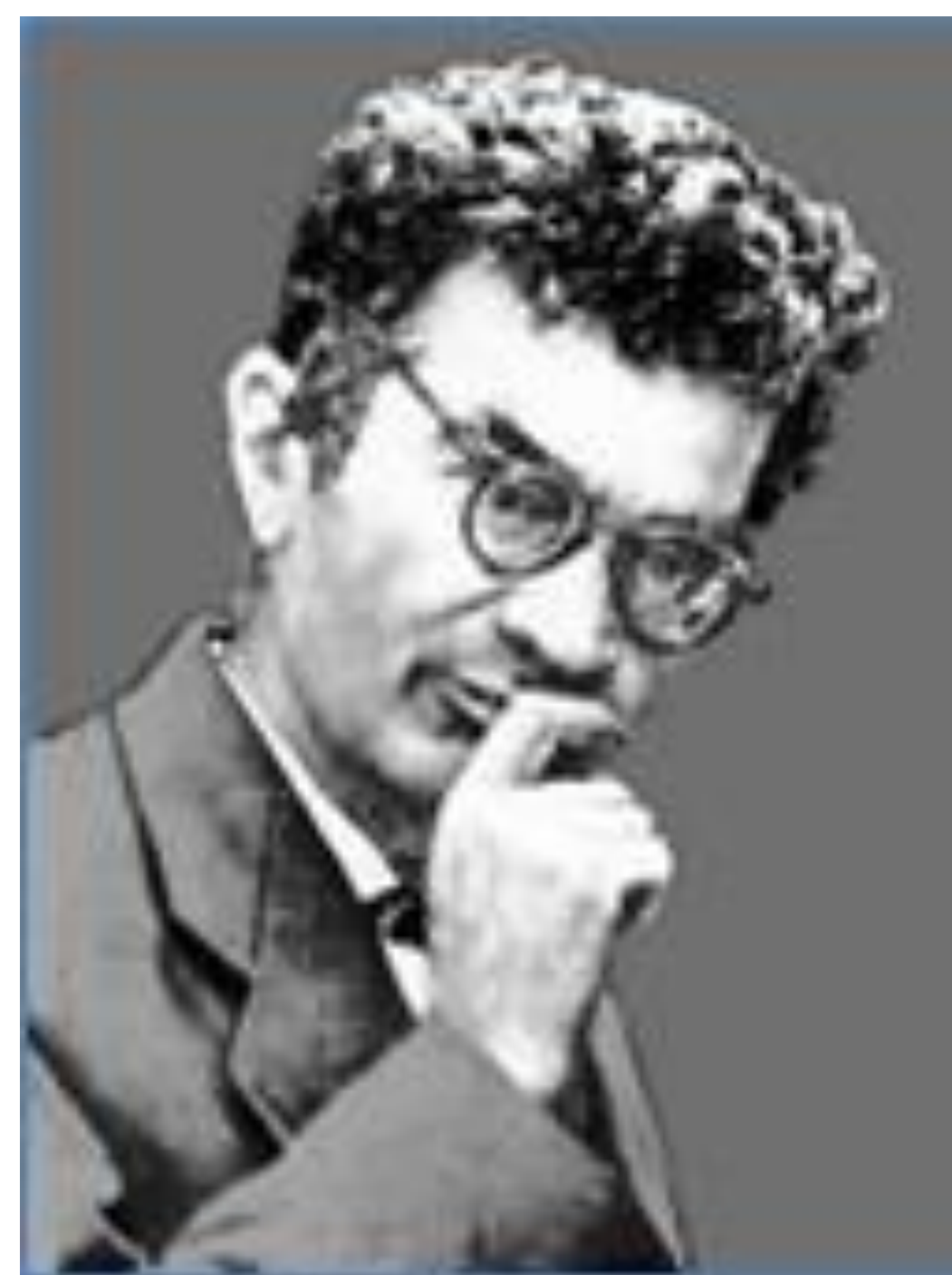
Исаак Яковлевич Померанчук дважды лауреат Государственной премии 1 ст., кавалер орденов Ленина, Трудового Красного Знамени и «Знак Почета», академик